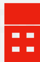
Без слаботочного отсека